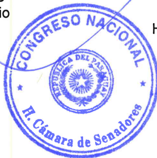
Silvio Ovelar B. Presidente H. Cámara de Senadores